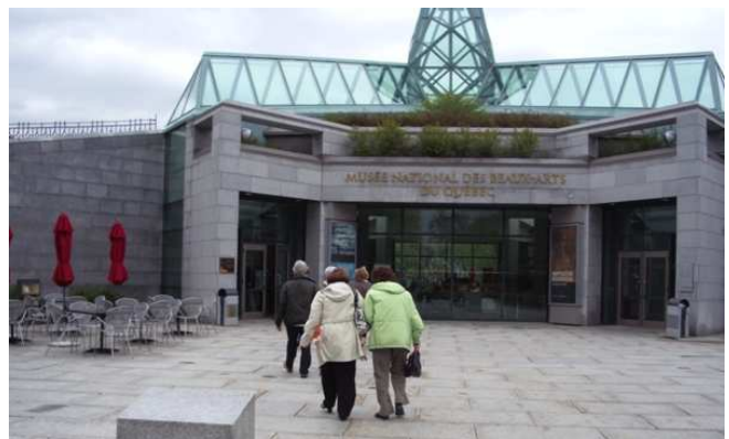
Vite entrons il pleut !