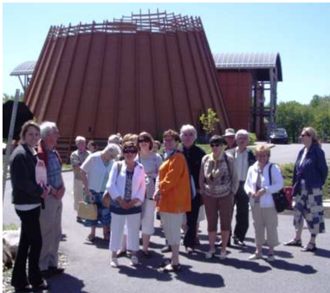
Un groupe de bénévoles et leur guide

Avez-vous déjà eu le plaisir de visiter le nouveau Musée Huron-Wendat ? Cette année, soit le 27 mai 2010, les personnes bénévoles ont été transportés sur ce site enchanteur et ont eu le plaisir de partager de bons moments et de faire de belles découvertes.